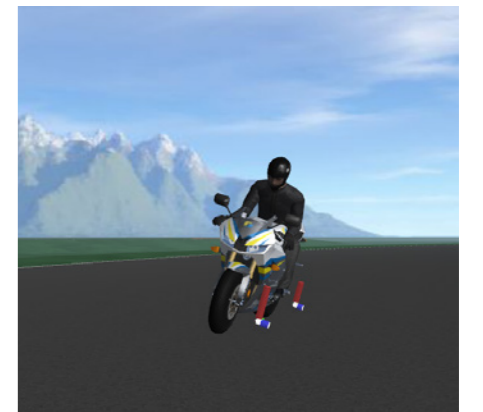
Visualisierung des Tests in IPGMovie

Die Continental Engineering Services GmbH erweitert mit diesem Hardware-in-the-Loop Prüfstand die Testlandschaft für die Entwicklung von Fahrdynamikregelfunktionen sowie Fahrerassistenzsystemen im Zweiradbereich.